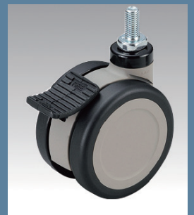
100φ自在 ダブルストッパー付ウレタン車

耐摩耗性、耐油性に優れています。 ダブルストッパー付は、車輪の回転と 軸の旋回をワンアクションで止める事 ができ、ワークテーブルをしっかりと 固定できます。