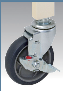
100φ自在 エラストマー車